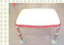
浴槽台: 浴槽から立ちやすいように浴槽の中へ入れて腰掛ける台