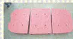
浴槽内すのこ: 浴槽の中に入れてかさ上げし、浴槽の出入りを助けるもの