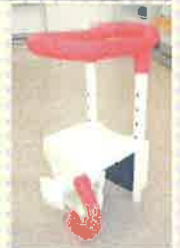
浴槽用手すり: 浴槽のふちに取り付ける手すり