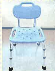
シャワーチェア: からだや髪を洗うときに座る椅子