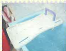
バスボード: 浴槽に置いて腰掛けてから浴槽をまたぐボード